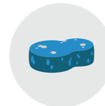
Éponge non abrasive