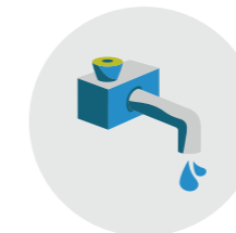
Eau tiède avec détergent inerte (pH 5 à 7)