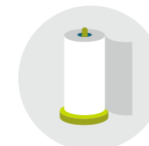
Essuyage avec chiffon doux et absorbant